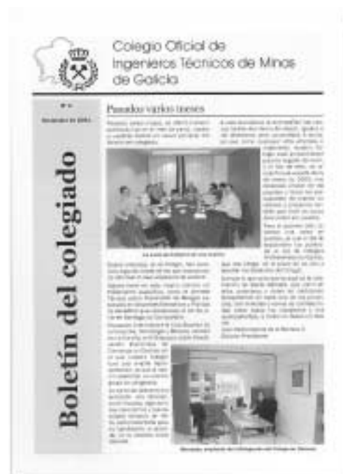
Portada de un ejemplar del Boletín

El Comité de Redacción que edita este Boletín desearía que puesto es un foro de expresión del colegiado y esta abierto a cualquier tipo de colaboración, en lo sucesivo aumentase la participación de los colegiados en el mismo.