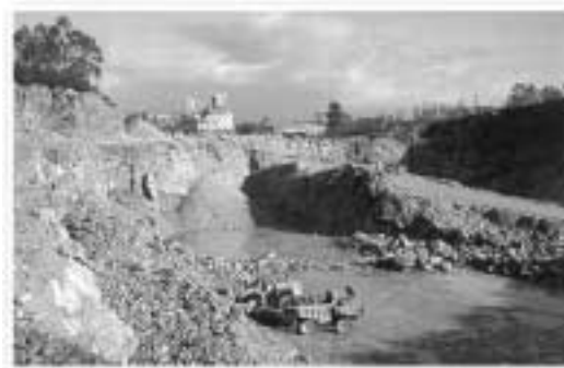
Explotación de áridos