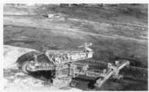
Rotopala en una explotación de lignito

La Secretaria informa de la baja de una colegiada.