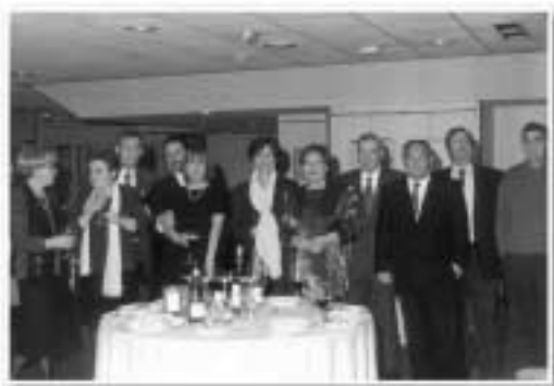
Asistentes a la cena de A Coruña

Terminada la cena, todos los que quisieron, pudieron bailar las canciones y melodías que la orquesta interpretó.