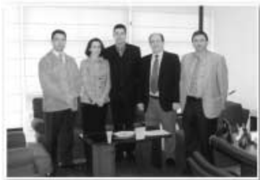
con el Director Xeral de Industria

a funcionar en el curso 2003-04, por nuestra parte ofrecemos toda la colaboración y apoyo para que así sea, por lo que se manda un escrito al Rector de la Universidad en esos términos.