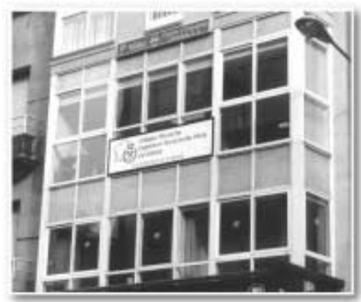
Fachada de la nueva Delegación de Ourense

Durante 2001, se han realizado diversos trabajos de mantenimiento del local consistentes principalmente en la pintura de las paredes del mismo, también se ha comprado mobiliario de archivo y un nuevo terminal de fax.