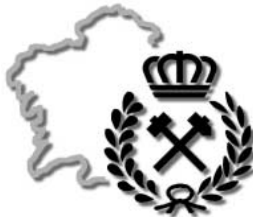
Nuevo logotipo del Colegio

Presentación y aprobación del nuevo logotipo del Colegio, que esta compuesto por el escudo de minas con corona en azul sobrepuesto al perfil de la Comunidad Autónoma de Galicia en rojo, se aprueba también el borrador del nuevo Boletín Informativo.