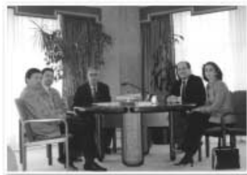
Entrevista con el Sr. Conselleiro de Industria

res facultativos, que se pretende publicar y a la que presentamos alegaciones conjuntamente con el Colegio de Ingenieros de Minas y la Cámara Minera de Galicia, también le ofrecimos nuestra colaboración y nuestra intención de estar presentes en todas las negociaciones que se establezcan para la creación de la Fundación o entidad similar, para la Utilización Alternativa de la Mina San Finx.