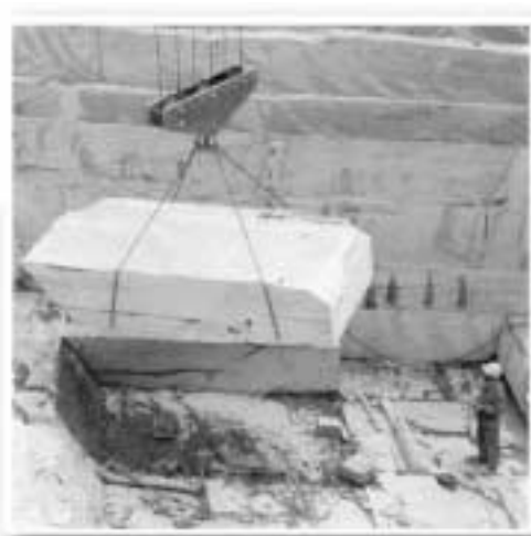
Cantera de pizarra

Se analiza la Junta General de 24 de noviembre, considerándola positiva aunque es preocupante la poca asistencia de colegiados a la misma.