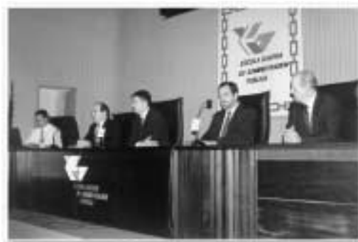
Inauguración Jornada Técnica

Colegio, se han celebrado en Lugo y Ourense dos cursos de nivel superior de Prevención de Riesgos Laborales, a los que han asistido cuatro colegiados.